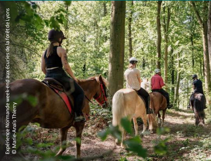
Expérience Normande week-end aux écuries de la forêt de Lyons