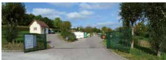
La déchèterie de Charleval.