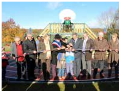
L'inauguration du city-stade