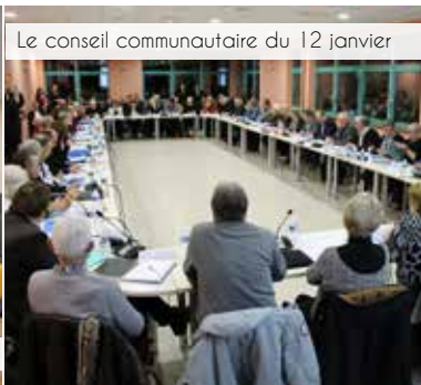
Le conseil communautaire du 12 janvier