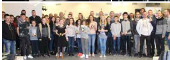
Les Lauréats sportifs de l'année 2015