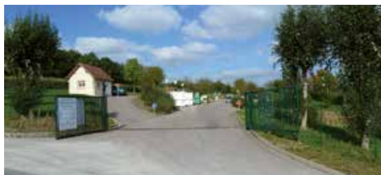
La déchèterie de Charleval.