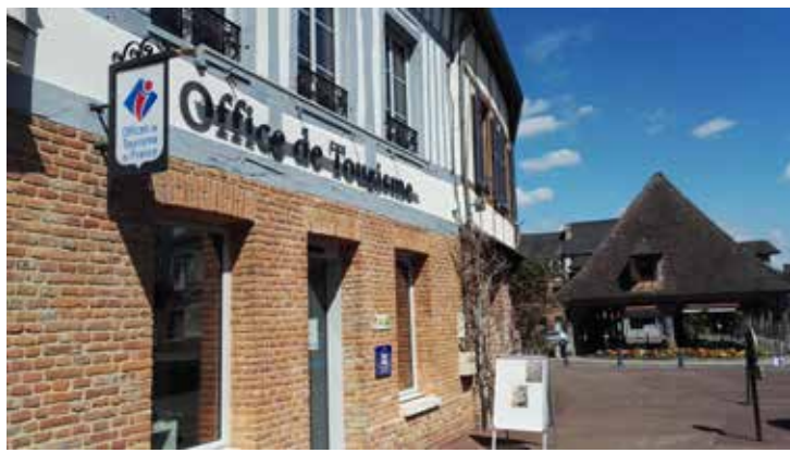
L'Office de tourisme est ouvert tous les jours près de la halle à Lyons-la-Forêt

aussi pour les groupes ou en individuel. Nous possédons le Label « Tourisme et Handicap » et pouvons donc répondre aux demandes face à un handicap auditif, visuel, moteur ou mental.