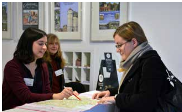
Trois conseillères en séjour vous accueillent et proposent des solutions personnalisées à vos besoins.