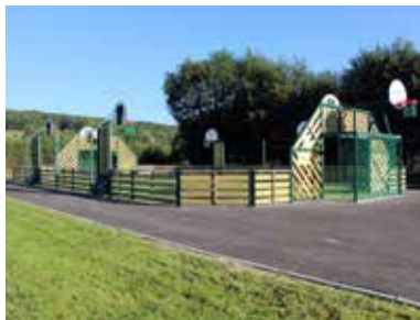
Le city-stade à Radepont