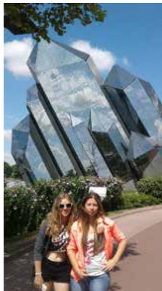
Séjour dans la Vienne en 2016

Les séjours sont ouverts à tous les jeunes du territoire, quelle que soit leur commune de résidence.