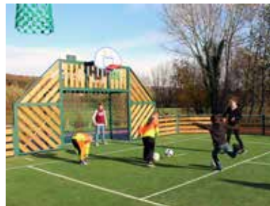
Le city-stade investi par les jeunes