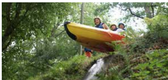
« Séjour sportif » en 2016

Pour les 12 - 17 ans, du 24 au 28 juillet 2017 à Torchamp dans l'Orne.