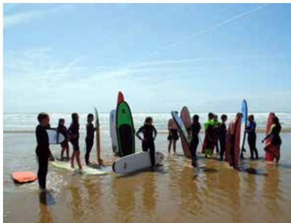
« Séjour surf » en 2016

Pour les 13 - 17 ans, du 8 au 15 juillet 2017 à Saint-Hilaire-de-Riez en Vendée.