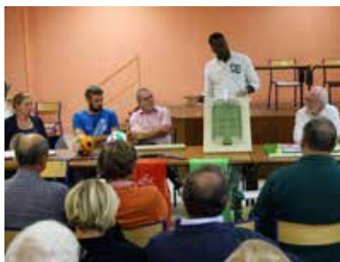
La réunion publique d'information