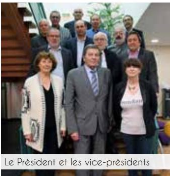
Le Président et les vice-présidents