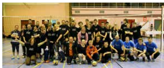
La Nuit du Volley d'avril 2016