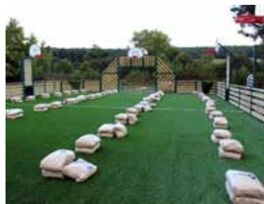
La pose du gazon synthétique