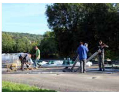
La construction avec des jeunes du territoire