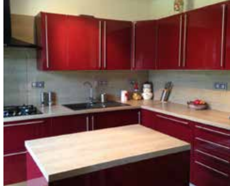
Installation de cuisine à Bois-Guillaume