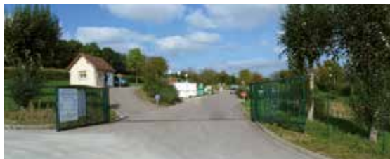
La déchèterie de Charlevall.