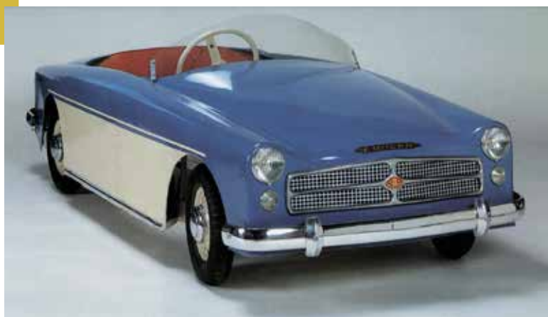
Christophe Kollmann © Région Normandie, Inventaire Général

La communauté de communes, le Pôle inventaire de la Région Normandie, la Spark Compagnie et la marque de jouets Euréka vous invitent à visiter le musée éphémère Euréka jusqu'au 30 juin 2019.